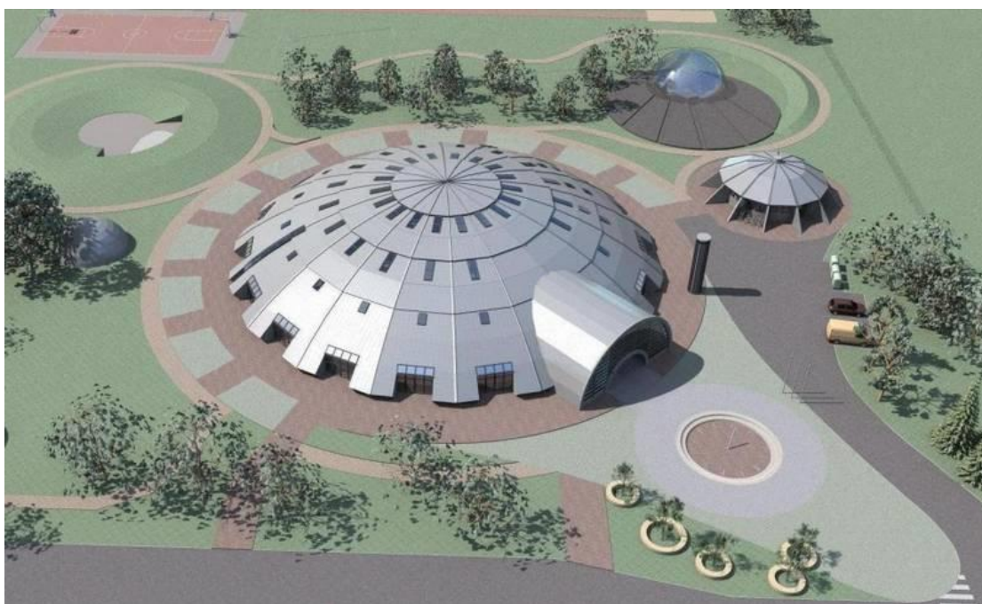
Pilt 1. Uus koolihoone. (2006)